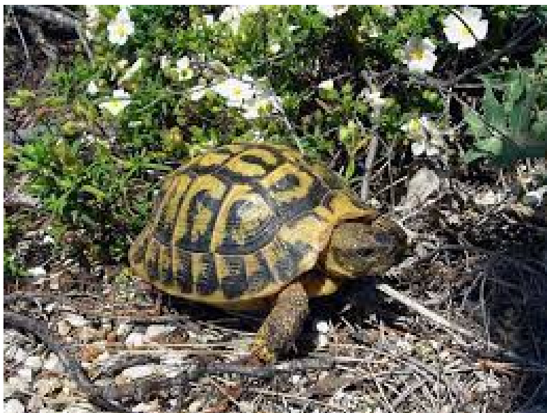
Tartaruga di terra ( Testudo hermanni )