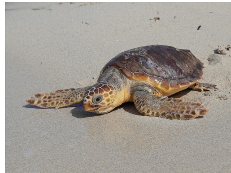
Tartaruga marina ( Caretta caretta )