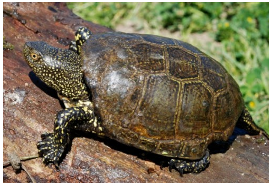
Tartaruga palustre ( Emys trinacris )